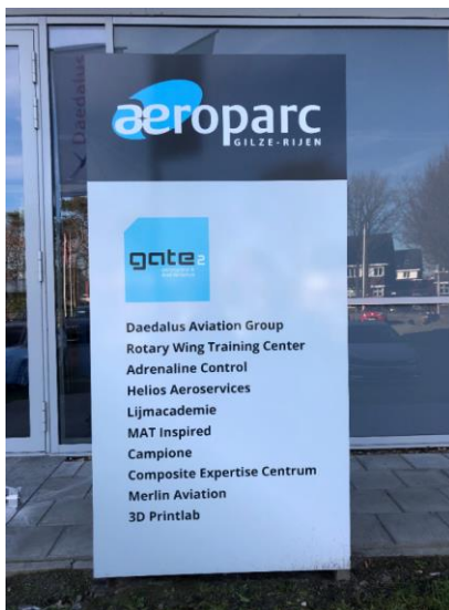
Entree van het opleidingscentrum Lijmacademie in gebouw Gate2, Ericssonstraat 2, 5121 ML Rijen