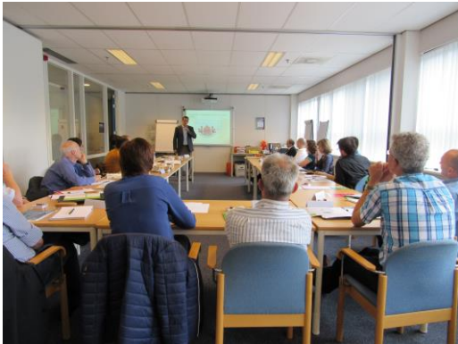
Eerste EAS Refresher in Nederland Lijmacademie, Rijen 1&2 juni 2016

Sinds begin 2011 zijn er zo'n 125 personen (nederlandstalig) tot het niveau European Adhesive Specialist (EWF 662 EAS) opgeleid. Het diploma is weliswaar geldig voor het leven, maar binnen de meeste kwaliteitssystemen is het wenselijk dat men aantoonbaar de kennis op niveau houdt. Deze tweedaagse EAS Refresher is daarvoor bedoeld, maar staat natuurlijk ook open voor andere belangstellenden.